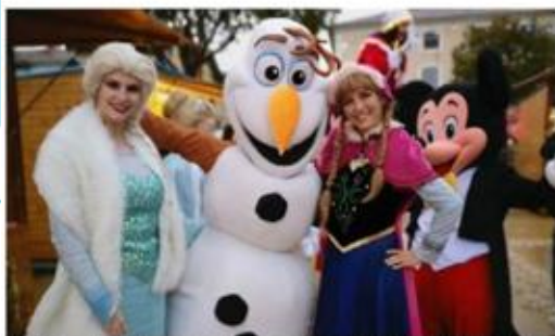
La Reine des neiges sera présente au marché de Noël.

Samedi et dimanche, place Jean-Jaurès, le marché de Noël ouvrira ses portes. De nombreuses animations compléteront le week-end.