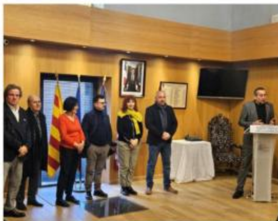
Les élus réunis pour accueillir les nouveaux résidents de la commune.

Les adeptes du vélo ont eu le plaisir d'apprendre qu'une véloroute va traverser Caumont, reliant à terme, Avignon, Cavaillon, puis, Pertuis. S'ils ne le savaient pas