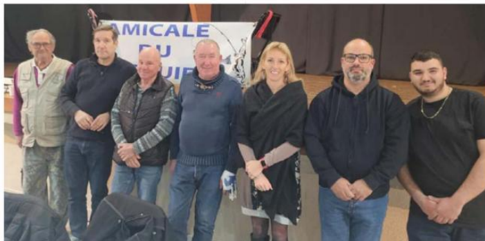
Cette année, ils ne sont pas moins de 78 sociétaires à avoir adhéré à l'Amicale du Pesquier.