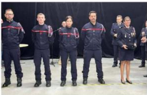
Plusieurs soldats du feu ont accédé au grade supérieur lors de la cérémonie de la Sainte-Barbe à Caumont-sur-Durance.

La sainte patronne des pompiers a été célébrée par les soldats du feu de la caserne de Caumont-sur-Durance - Châteauneuf-de-Gadagne.