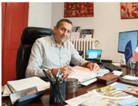
Le maire de Caumont-sur-Durance, Claude Morel, repartira aux élections municipales de 2026.

Ainsi, culture, commerce, mobilité, sécurité sont au cœur du nouveau projet porté par Claude Morel qui revendique une urbanisation qui ressemble aux attentes des Caumontois, un taux d'atteinte aux biens et